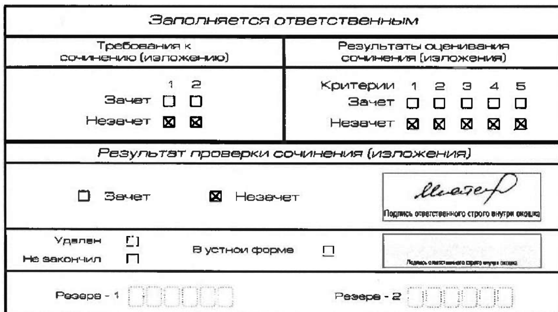
Рис. 6. Область для оценки работы