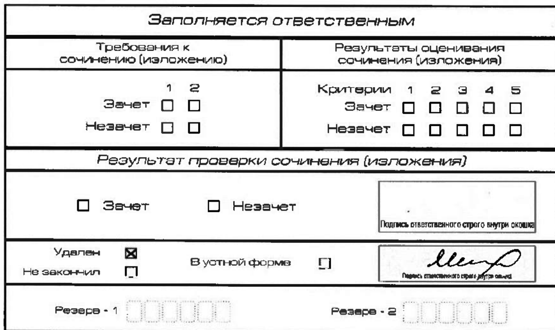
Рис. 11. Заполнение полей нижней части бланка регистрации (удаление с экзамена)